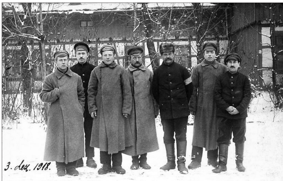
1. att. Vieni no pirmajiem brīvprātīgajiem. Avots nezināms.