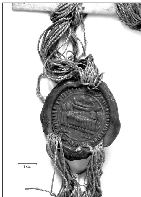
2. att. Livonijas ordeņa mestra zīmogs. 1330.

Jaunavas Marijas attēlojums Jēzus dzimšanas ainā izsekojams, sākot ar 5. gadsimta beigām, pirms tam Jaunava Marija tika iekļauta tikai Jēzus apbrīnošanas ainās. Savukārt Jāzezs gandrīz vienmēr atveidots kā vecāks vīrs. Vērša un ēzeļa attēlošanai Jēzus dzimšanas ainā ir dziļas saknes agrās kristietības mākslā, kur daudzos gadījumos šie dzīvnieki bija vienīgie,