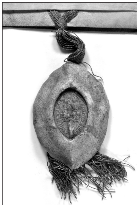
4. att. Rīgas arhibīskapa Jāņa II fon Fehtena zīmoga reverss. 1287.

Apokalipses sieviete no Jāņa Atklāsmes grāmatas ir raisījusi daudzas diskusijas par to, ko viņa simbolizē. Katoļu tradīcijā attēlotā sieviete tiek identificēta kā Jaunava Marija, jo tiek pieminēts viņas dēls (Jāņa