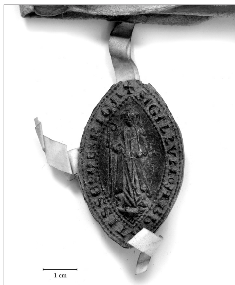
1. att. Svētās Marijas Magdalēnas abatijas Rīgā abates Ģertrūdes zīmogs. 1336.

Karaļi un karalienes ne tikai zīmogos, bet arī daudzviet citur izvēlējās sevi attēlot līdzīgi, kā jau kopš 4. gadsimta tika attēlots Jēzus Kristus – sēžot tronī un rokās