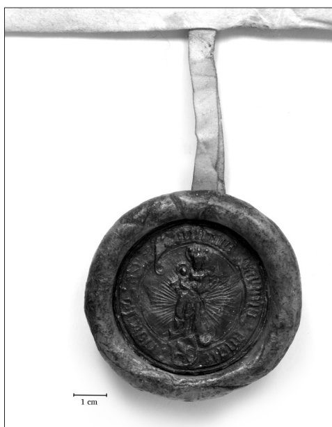
5. att. Rīgas domkapitula sekretizīmogs. 1518.

Kopš 13. gadsimta Marijas pielūgšanas kultā iezīmējās izmaiņas – viņa tiek skatīta ne vairs kā visvarena valdniece, bet gan kā maiga māte. Gan vizuālajā mākslā, gan rakstītajos avotos viņa zināmā mērā kļuva tuvāka lūdzējiem, un šī tendence turpinājās visu viduslaiku periodu. Tomēr šīs izmaiņas nevajadzētu uztvert kā novirzīšanos no Marijas kā valdnieces tēla, drīzāk tās saistāmas ar mātišķuma uztveres izmaiņām, t. i., Marijas reprezentācija un viņas pielūgšana galvenokārt saistīta ar varu un autoritāti – tā Marijas kā Dieva mātes statuss tika uztverts viduslaiku sabiedrībā. 50