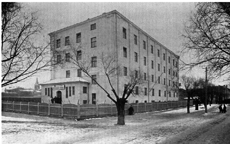
2. att. Naktspatversme Fridriķa ielā ap 1912. gadu. Autors nezināms. In: Kratkij obzor dejatel'nosti Rizhskoj gorodskoj upravj za 1912. g. Rīga 1913.

Patversmes ēka bija četrus stāvus augsta, tās pagrabā atradās sētnieka dzīvoklis, noliktava, ogļu un malkas glabātuve, apkures katls un veļas mazgātava; 1. stāvā atradās priekštelpa, ģērbtuve, mazgāšanās telpa, garderobe, žāvētava un sarga dzīvoklis; 2. stāvā – noliktava, divas istabas kalpotājiem, virtuve, ēdnīca, sarga guļamistaba un dzīvoklis; 3. stāvā – vadītāja dzīvoklis, divas guļamistabas un sarga dzīvoklis; 4. stāvā – sešas istabas patversmes apmeklētājiem. 118