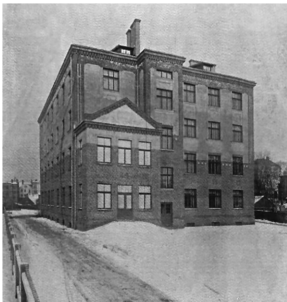
1. att. Bērnudārzs un silīte Jēkabpils ielā ap 1912. gadu. Autors nezināms. In: Kratkij obzor dejatel'nosti Rihzskoj gorodskoj upravj za 1912. g. Rīga 1913.

1910. gadā pilsētas dome palielināja atbalstu jaunu palīdzības iestāžu ierīkošanai un tika ielānota bērnudārza un silītes izveide Maskavas priekšpilsētas iedzīvotājiem. 91 Līdzīgas iestādes, kuras nodarbojās ar bērnu aprūpi, jau bija atvērtas Hermana ielā 19 (dibināta 1655. gadā), 92 Hospitāļu ielā 1 (dibināta 1870. gadā), Patversmes ielā 23 (dibināta 1884. gadā), 93 Matīsa ielā 79 (dibināta 1877. gadā) 94 un Sparģeļu ielā 2 (dibināta 1907. gadā). 95 Tas liecina,