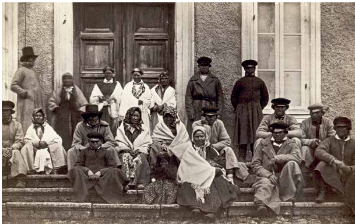
7. att. Fotografija ar oriģinālo parakstu "Barona Korfa Kreicburgas muižas zemnieki" VUB F46-781

Pirmajā rindā no kreisās sēž pusaugu zēns, kuram mugurā patumšas krāsas garie svārki ar āķu aizdari. Pie kakla saskatāma krekla apkakle, galvā – tumša auduma naģene ar spīdīgu ādas nagu, kurš nedaudz iebuktēts. Tālāk pa labi sēž maza meitene, kuras apģērbā saskatāmi apdrukāta kokvilnas auduma brunči vai sarafāns, ap galvu un pleciem apsiets tumšs lakats ar bārkstīm un krekla labā piedurkne ar savilkumu un piešūtu aproci. Tālāk sēdošā ir jauna sieviete ar zīdaini klēpī. Zīdainis satīts vienā vai vairākos lakatos, kamēr sieviete ģērbusies tumša auduma svārkos, vismaz trīs krāsu sīkrūtaina auduma brunčos, ap pleciem viņai apsegta balta villaine ar garām bārkstīm, kājās plāni ādas zābaki. Pie kakla redzama atlokāma, nerotāta krekla apkakle, galvā viņai ir gaiša, apdrukāta kokvilnas, zīda vai smalkvilnas auduma lakats, kas sasiets zem zoda. Tālāk sēdošajam vīrietim mugurā paplati pelēka auduma svārki ar platu apkakli un atlokiem, viduklī apsiets ar tekstilu jostu. Pie kakla redzami vēl vieni tumši svārki vai veste, kas sapogāti līdz augšai. Krekls ar atlokāmu