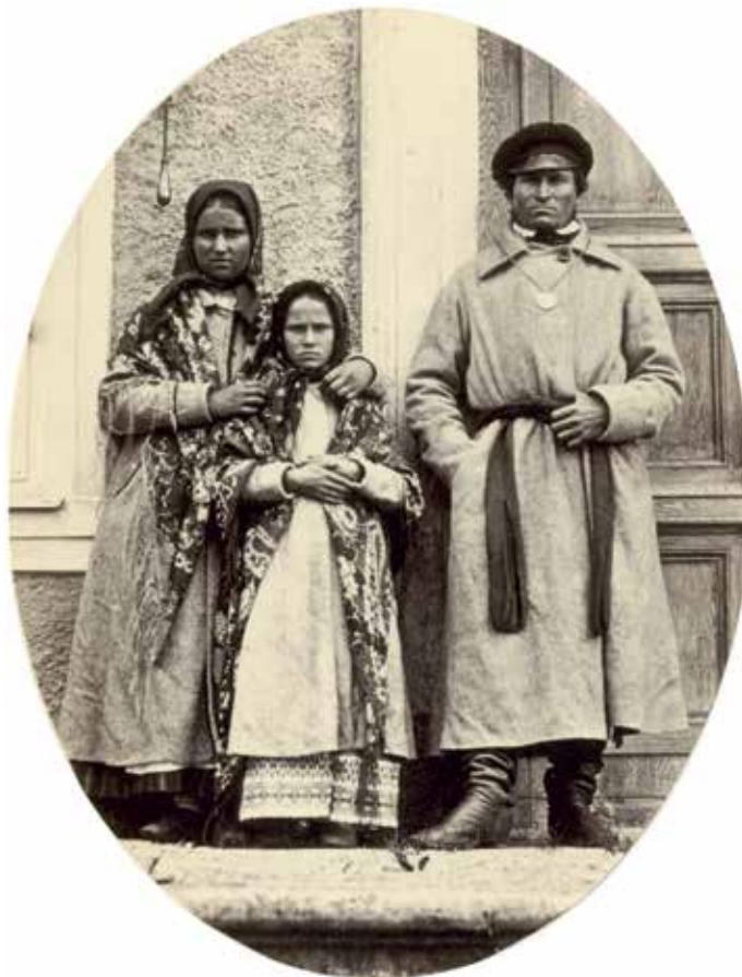
3. att. Fotogrāfija ar oriģinālo parakstu "Dinaburgas apriņķa Ungurmuižas pagasta zemnieki" VUB F46-776. Tajā redzams pagasta vecākais un viņa ģimene

Blakus šim vīrietim stāv jauna sieviete un pusaugu meitene. Jaunās sievietes attēls pilnā augumā ir analizējams kopā ar viņas portretu, kam pievienots paraksts "Kreicburgas apkārtnes zemniece" (4. attēls). Viņa ģērbusies pelēkas vadmalas garajos svārkos ar atlokāmu apkakli un atlokiem piedurkņu