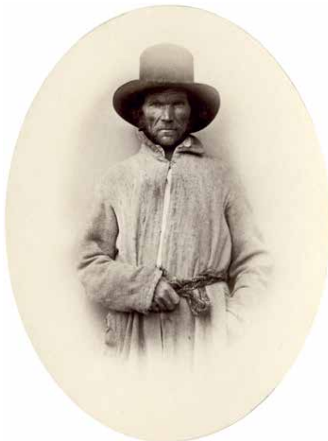
6. att. Portrets ar oriģinālo parakstu "Dinaburgas apriņķa Kreicburgas pagasta zemnieks – luterānis" VUB F46-779

Nākamā fotogrāfija ar tādu pašu parakstu "Dinaburgas apriņķa Kreicburgas pagasta zemnieks – luterānis" ir gados vecāka vīrieša portrets (6. attēls). Tajā saskatāms, ka vīrietis ģērbies vienkārša piegriezuma, no pelēka vilnas triniša auduma šūtos svārkos ar paplatu apkakli un viena āķa aizdari pie kakla. Šķiet, ka šiem svārkkiem ir kabatas. Ap vidu svārki sasieta ar pīto jostu vismaz divās krāsās, kura apņemta divkārt, uz vēdera sasieta mezglā un gali aizbāzti aiz jostas katrs savā pusē. Gan josta, gan svārki izskatās novalkāti un padiluši. Tajā pašā laikā iespējams saskatīt arī šuvuma pēdas, kuras liecina par piedurknes piegriezumu, kāds raksturīgs arī mājās darinātajiem krekliem ar sašaurinātiem dūrgaliem (CVVM 12811, 12816, un 12821 no Aizkalnes pagasta; CVVM 12822 no Vārkavas pagasta; CVVM 27600 no Rudzātu pagasta), proti, piedurknes audums nav piegriezts sašaurināts, bet atlocīts