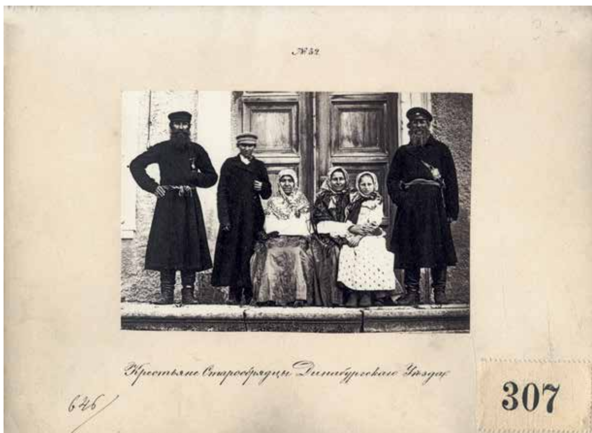
1. att. Fotogrāfija ar oriģinālo parakstu "Dinaburgas apriņķa zemnieki vecticībnieki" VUB F46-780. Tā uzlīmēta uz kartona pamatnes, uz kuras ar roku pierakstīta anotācija. Līdzīgi anotācijas pierakstītas arī pārējām fotogrāfijām