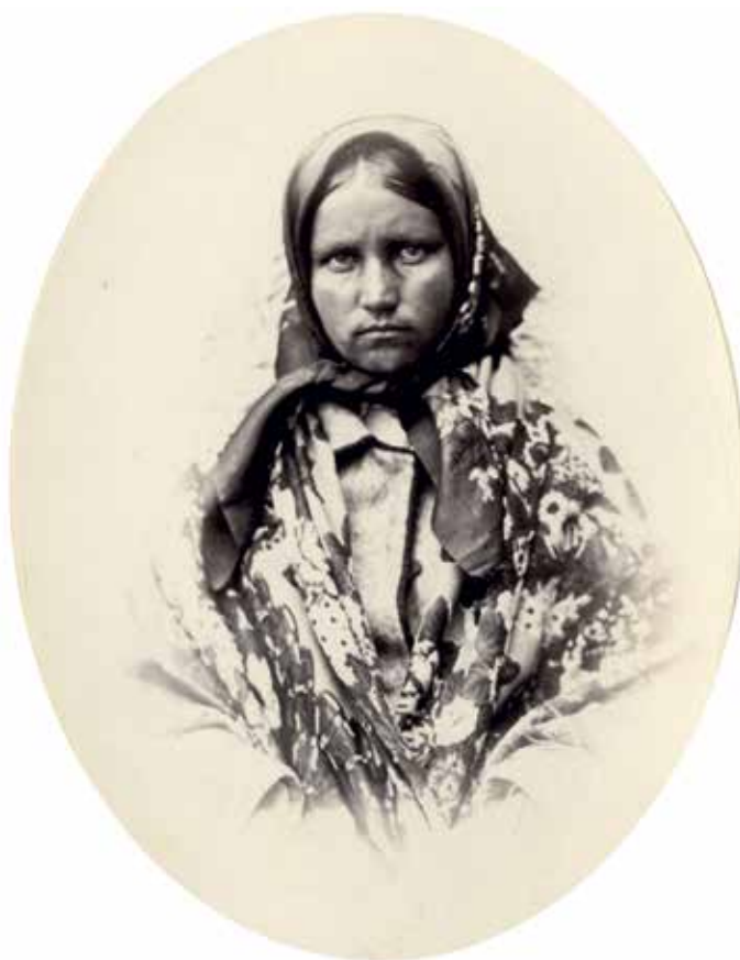
4. att. Portrets ar oriģinālo parakstu "Kreicburgas apkārtnes zemniece" VUB F46-778. Tajā redzama tā pati jaunā sieviete, kas 3. attēlā

galos. Ap apkakli, atlokiem, kakla izgriezumū, priekšējo aizdari un kabatu atvērumiem redzama rotājoša malas apdare, iespējams, tumši zilā vai melnā krāsā. Svārku aizdares veids nav saskatāms, neredz arī jostu, iespējams, ka aizdare veidota ar āķiem. Pie kakla redzams krekls. Svārku garums ir zem ceļiem, zem svārkiem saskatāma balta priekšauta mala, kā arī vertikāli svītraini brunči vismaz trīs krāsās. Iespējams, saskatāms neliels fragments no gaišas zeķes, kā arī apavi. Apavu forma nav nosakāma, vien redzams, ka tie ir plāni un ar plānu zoli. Ap pleciem sievietei segts liels, plāns lakats ar gaišām bārkstīm. Lakata audums varētu būt kokvilnas, zīda vai smalkvilnas, tas ir apdrukāts ar ziedu motīva rakstu. Galvā viņai apdrukāts lakats bez bārkstīm, kas sasiets zem zoda tā, ka nedaudz redzami mati, kas vidū pāršķirti ar celiņu. Lakata audums varētu būt līdzīga materiāla