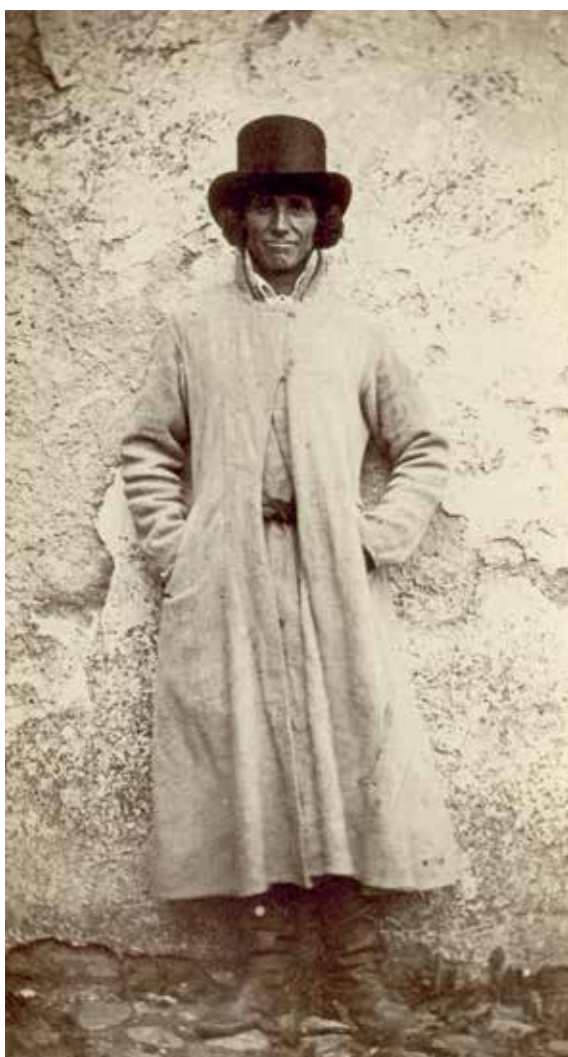
5. att. Fotogrāfija ar oriģinālo parakstu “Dinaburgas apriņķa Kreicburgas pagasta zemnieks – luterānis” VUB F46-777

plāna, gaiši pelēka vilnas auduma, ar paplatu apkakli, ieslīpām kabatām sānos. Svārku piegriezums ir vienkāršs, tie aiztaisīti ar diviem aizdares āķiem, no kuriem viens ir pie kakla un otrs – uz krūtīm. Zemāk virsējie svārki atstāti vaļā. Zem virsējiem svārkiem redzami otri līdzīga garuma svārki ar tādu pašu apkakli. Šiem svārkiem ap vidu apsietu tekstila josta, taču tās darināšanas tehniku vai sējuma veidu precīzāk grūti saskatīt. Pie kakla redzama krekla aizdare ar nelielu metāla saktiņu, kā arī plata apkakle, kura labajā pusē nolocīta, bet kreisajā – stāv paralēli abām svārku apkaklēm. Kājās vīrietim ir tumšas ādas zābaki, bet galvā – tumša vilnas platmale.