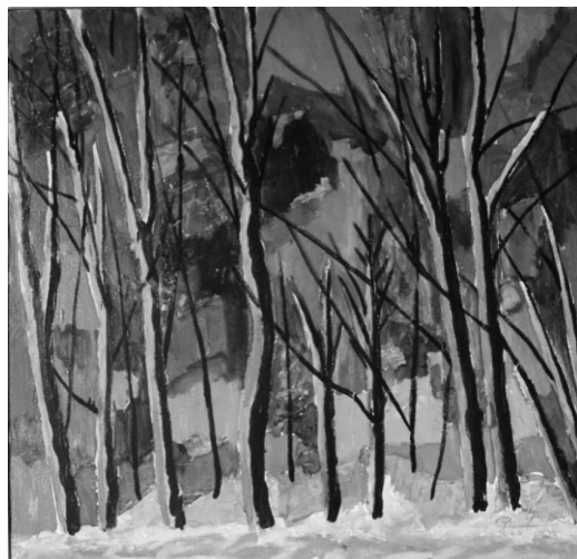
5. attēls. Rudens (1976). Rūdolfs Pinnis, Vidzeme