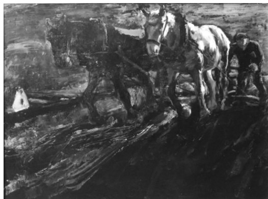
3. attēls. Pirms 20 gadiem (1965). Ģederts Eliass, Zemgale