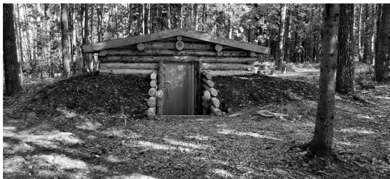
7. attēls. Atjaunotais Stompaku nomettes baznīcas bunkurs.

kurās varēja uzturēties ap 400 cilvēku. Vienā zemnīcā bija pat iekārtota baznīca. 1945. gada 2. martā šeit notika Stompaku kauja, kad zemnīcām uzbruka čekas karaspēks. 2022. gadā tika atklāta atjaunotā nomettes baznīca, kuru iespējams aplūkot attēlā.