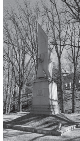
1. un 2. attēls. Pirmā Latvijas neatkarības laika (1920–1940) pieminēkli, kuri netika nojaukti padomju gados (Viesīte, Rauna).