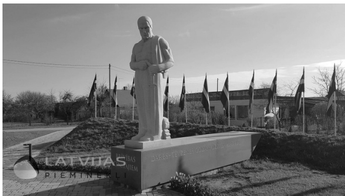
5. attēls. Piemineklis Latvijas atbrīvošanas cīņās un Pirmajā pasaules karā kritušajiem Aļojas draudzes locekļiem.

kurai ir sena muižas vēsture un parks, bet arī piemiņas plāksne par godu O. Kalpaka Latvijas armijas vienībām, kuras no Rudbāržiem uzsāka Latvijas atbrīvošanu 1919. gada 3. martā. Abās vietās varam izsekot piemiņas vietu atklāšanas vēsturei un likvidēšanai padomju gados un atkal atjaunošanas darbiem kopš 1988. gada.