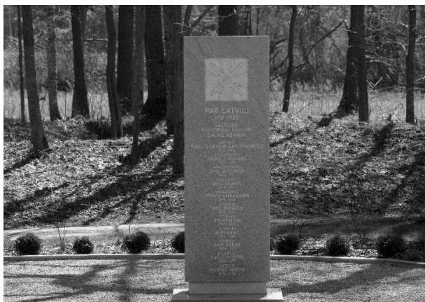
4. attēls. Piemiņas stēla Biržos.

Šis piemērs spilgti parāda pieminekļu likteni totalitāro režīmu varas laikos. Īpaši aktīva ir pieminekļu demontāža 20. gadsimta piecdesmitajos gados, kas saistīts ar sovjetizāciju, tiklab centrālās, kā arī vietējās varas aktivitātēm. Līdzīgi varam izsekot Latvijas baznīcu slēgšanai, demolēšanai un pārvēršanai par dažādiem padomju varai noderīgiem sabiedriskiem vai saimnieciskiem objektiem.