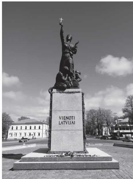
3. attēls. Latgales Māra .

tēlnieka Leona Tomašicka mets, bet pašu pieminēkli veidojis tēlnieks Kārlis Jansons. Kad Latviju okupēja PSRS, pieminēklis 1940. gada 6. novembrī iznīcināts, 1943. gada 22. augustā atjaunots, 1950. gada 24. jūnijā atkal iznīcināts. Atjaunots un no jauna atklāts 1992. gada